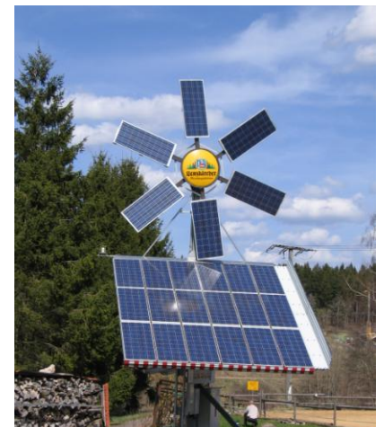
2008 wurde von E. Maier das „Solar-Windrad“ auf dem Gelände der Fa. Rogg in Betrieb genommen.

Der Ertrag liegt bisher deutlich über den Prognosen. Wir haben mit den beiden Photovoltaik-Anlagen 106.000 KWh Solarstrom erzeugt.