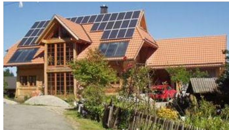
Die PV Anlage und die Solarthermische Anlage der Familie Schulz in Grünwald.

2006 gab es bei der Planung, dem Bau und der Umsetzung, außer Finanzierungsfragen, keine Probleme.