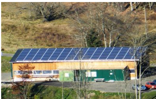
Bilanz PV Anlagen BElEG 2011-2021